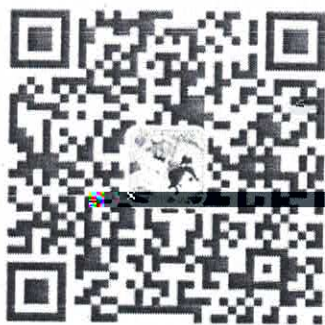
农业银行信用卡微信服务号

卡”——“申请进度查询”；或者“农业银行信用卡”微信小程序，选择“信用卡申请—申请进度查询”。