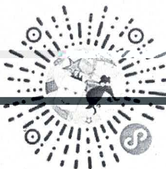
农业银行信用卡小程序